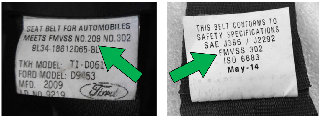
Obrázok č. 4