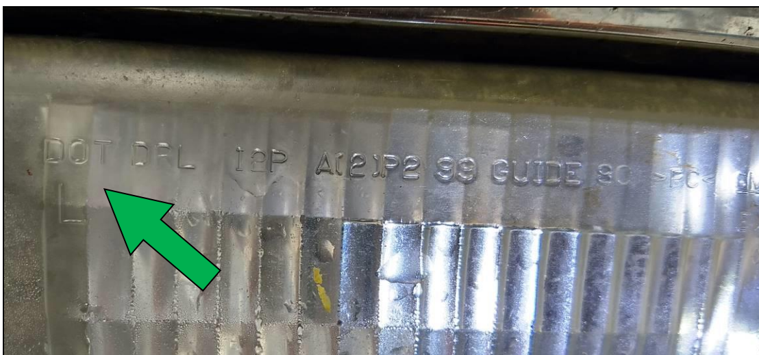
Obrázok č. 2

Alebo v prípade svetidla znázorneného na obrázku č. 3 uviesť: „Zohľadnená automaticky uznávaná výnimka - 4.3.3 Brzdové svetidlá nespĺňajú predpísané požiadavky podľa EHK/EÚ, ale spĺňajú alternatívne požiadavky - schválené podľa DOT“.