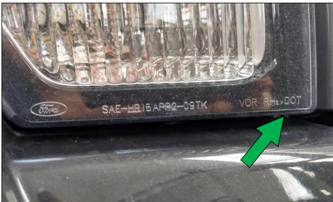
Obrázok č. 1

V takomto prípade je potrebné uviesť: „Zohľadnená automaticky uznávaná výnimka - 4.1.4 Stretávacie a diaľkové svetlomety nespĺňajú predpísané požiadavky podľa EHK/EÚ, ale spĺňajú alternatívne požiadavky - schválené podľa DOT, na vozidle zistené: (FORD) SAE- HR15APP2-09TK VOR RH 2 DOT.“