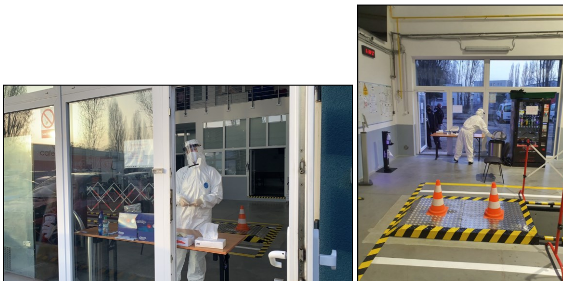
V čase mimoriadnych opatrení sme zaviedli testovanie účastníkov našich vzdelávacích akcií na ochorenie COVID-19.

Oblasť vzdelávania bola zo všetkých oblastí našich činností najviac poznačená pandémiou. K doterajším hygienickým opatreniam, ako bola zmena konfigurácie výukových priestorov, nákup zariadení na dezinfekciu alebo automatické meranie telesnej teploty pri vstupe do budovy, sme doplnili testovanie účastníkov našich vzdelávacích podujatí na ochorenie COVID-19, vykonávané priamo v našom školiacom stredisku prostredníctvom kvalifikovaného personálu.