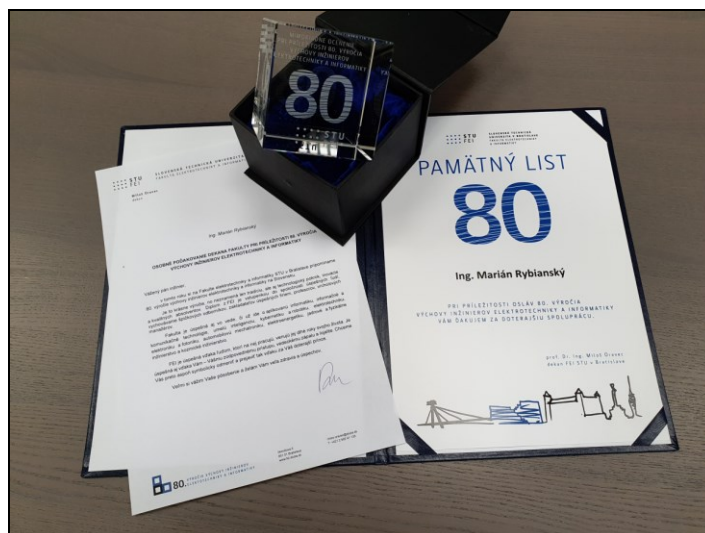
Ocenenie udelené dekanom FEI STU v Bratislave.

Fakulty elektrotechniky a informatiky (FEI) a z Ústavu dopravnej techniky a konštruovania Strojnickej fakulty STU v Bratislave, TESTEK pokračoval v spolupráci s pracovníkmi a študentami oboch ústavov a fakúlt STU na odborných projektoch, súvisiacich s našim výskumom a vývojom. Mimoriadne nás v tejto súvislosti potešilo poďakovanie a ocenenie za doterajší prínos v tejto oblasti, udelené dekanom FEI STU v Bratislave pri príležitosti 80. výročia výchovy inžinierov elektrotechniky a informatiky na Slovensku.